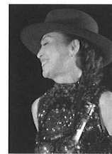
TOMOKO members club 無限水

知っているようで知らない日本茶の魅力を伝えていきたいと思い、2002年に日本茶専門店 茶倉 SAKURAを横濱元町にオープンしました。代官坂のお店では茶葉の販売と有機栽培の日本茶を中心に常時20種類程度の日本茶をカフェにて提供しています。鉄瓶で沸かしたお湯で1煎ずつ淹れる日本茶で本来の香り、味わいをお楽しみいただいています。又、日本茶を使った SWEETS、お食事も自ら考案しメニューにしています。このように日本茶の魅力を日々伝えていくことが出来るのはとても嬉しいです。今回は 一人一人にフィットする自分茶のススメと共に、このイベントに合う特別ブレンドティーをご用意しました。